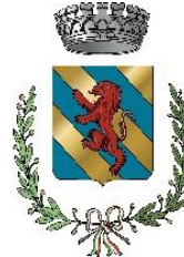
Comune di Missaglia