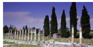
Aquileia ( sito archeologico)