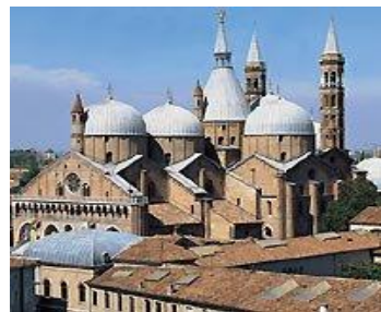
Padova (Basilica del Santo)