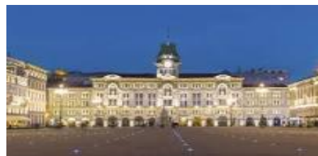
Trieste (Piazza Unità d'Italia)