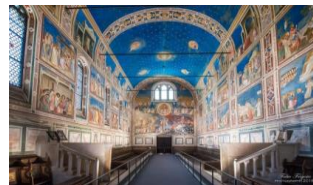
Padova (Cappella degli Scrovegni)